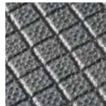
Rautenprofil mit Deckschicht